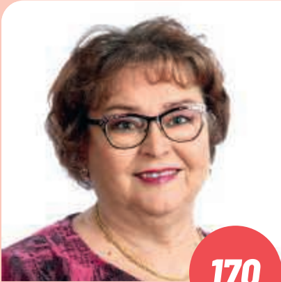
Ikä: 65 aluepäällikkö, KM, eläkkeellä, TURKU