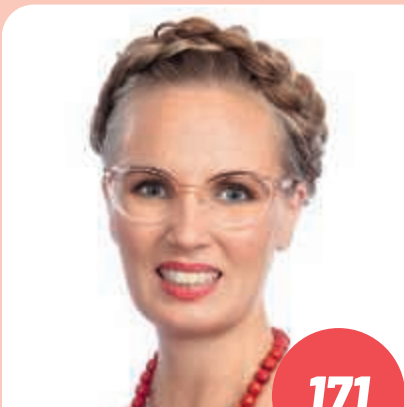
Ikä: 44 yliopettaja, terveystieteiden tohtori, TURKU

Veisin eduskuntaan työelämän vahvaa asiantunte- musta - tavoitteena reilumpi työelämä. Lähtökohdistani ja työni vuoksi tiedän, että sosiaaliturva ja julkiset palvelut (mm. päivähoito, koulut, terveydenhoito, vanhus- tenhoiva) ovat tavallisen ihmisen arjen turvana. Niitä ei saa vaarantaa. Myös Saaristomeremme suojelu vaatii panostuksia, jotta se säilyisi tuleville polville.