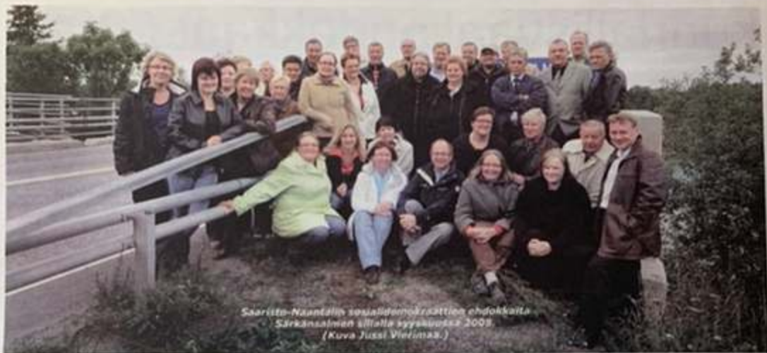
Saaris-to-Naantalin sosiaalidemokraattien ehdokkaista Sääksälän sillalla syyskuussa 2008