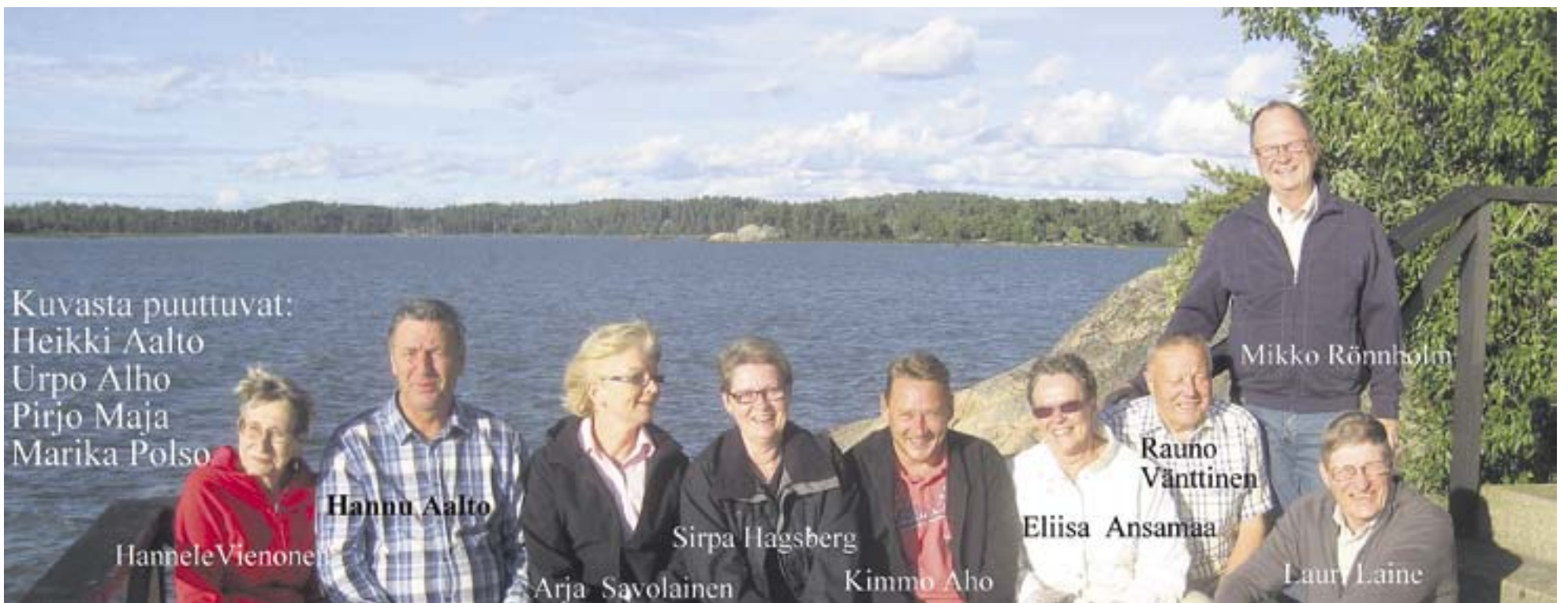
Naantalin SDP:n valtuustoryhmä 2009-2012.