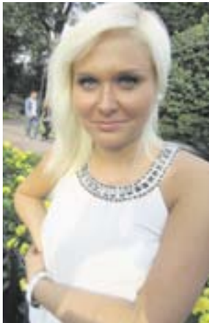
pa. Jokaiselta opiskelijalta kysytään henkilökohtaisessa

”Jos halua vain löytyy, nuorten ja nuorten aikuisten hyvinvointiin voi vaikuttaa ennaltaehkäisevästi hyvinkin käytännöllisin toimin. Raision kauppaoppilaitoksessa on toteutettu hieno ta-