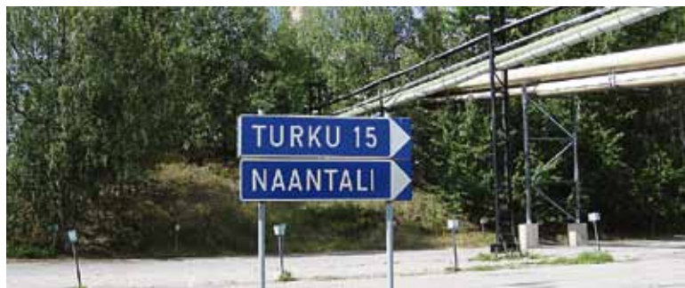
Turku ja Naantali toimivat itsenäisinä, mutta samaan suuntaan koko seudun parhaaksi.