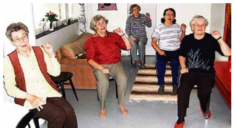
Tuolijumppaa Ruonan kerhotilassa.