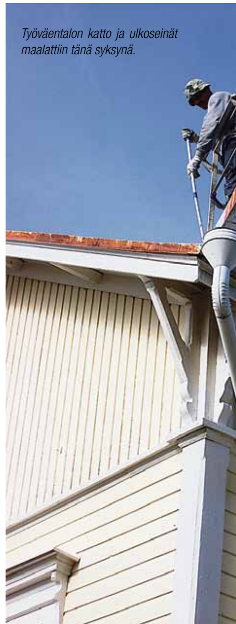
Työväentalon katto ja ulkoseinät maalattiin tänä syksynä.

säksi säätiön vuokralaisina lukuisia pienyrittäjiä: atk-ohjelmistoyritys, kirjanpito- ja laatuvaatevarasto ja parturi-kampaamo. Muun muassa naapuritaloyhtiö käyttää yläkerran kokoustiloja.