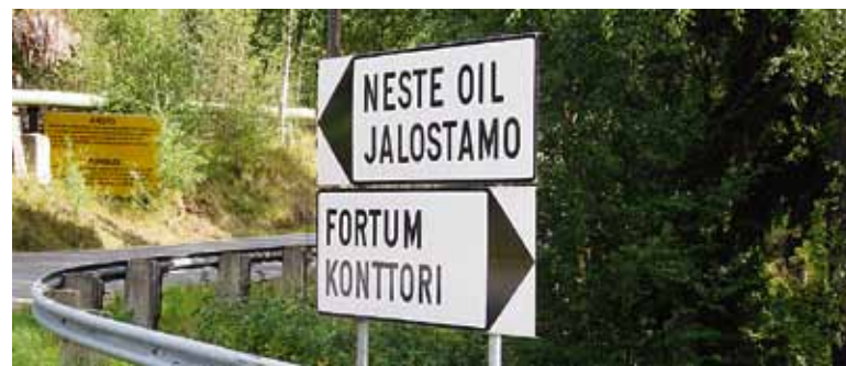
Nesteen ja Fortumin Naantalin-laitokset ovat jo vartuneessa iässä. Tietenkin kysymme, mitä yhtiöt aikovat? Mutta vielä tärkeämpää on miettiä, mitä Naantali voi tehdä paikallisten laitosten kehittämiseksi.

Siksi Naantalin on huolehdittava siitä, että se tuottaa itsenäisenä koko seudulle suurempaa lisäarvoa kuin osana Turun kaupunkia. Tässä joudutaan lähelle Kekkonen ul-