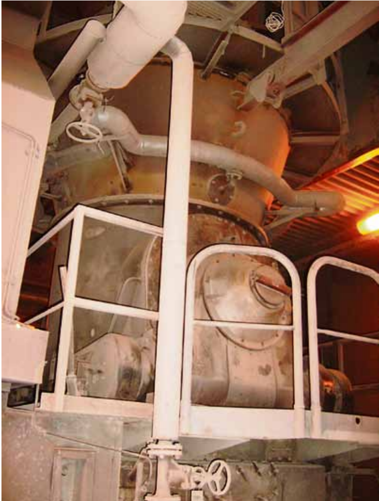
Hiilimyly polttaa kivihiiltä yli 1 300 asteen kuumuudella.

Fortumin Naantalin-voimalaitos on työllistänyt Turun alueen ihmisiä 50 vuotta. Bioraaka-aineen käyttöpakko ajaa nykyisen tuotantomenetelmän muutaman vuoden kuluksena alas. Henkilöstön mielestä hiiltä haukkaava voimalaitos ei ole kuitenkaan ikäkriisissä, vaan huippukunnossa.