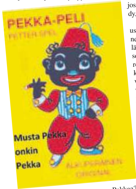
Kuka pelaa Naantalissa Mustaa Pekkaa?

Päätöksien aikaansaaminen edellyttää valtuuston kaltaisessa suuressa kollegiossa ryhmätoimintaa: samanmielisesti ajattelevat ovat järjestäytyneet puolueiksi ja puolueryhmiä, jotka keskuudessaan etsivät yhteistä linjaa. Sitä he tarjoavat muillekin ryhmille. Lopullinen päätös syntyy