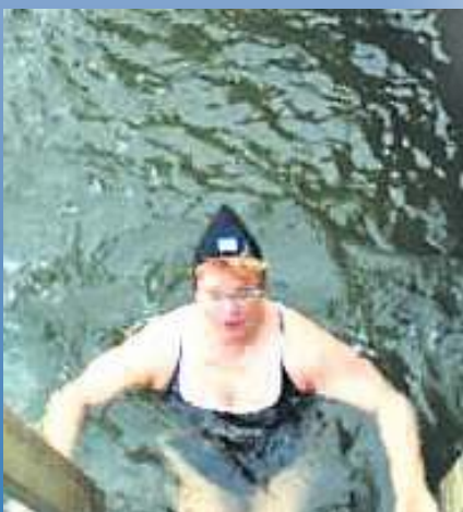
Hei, tulkaa UIMAAN!