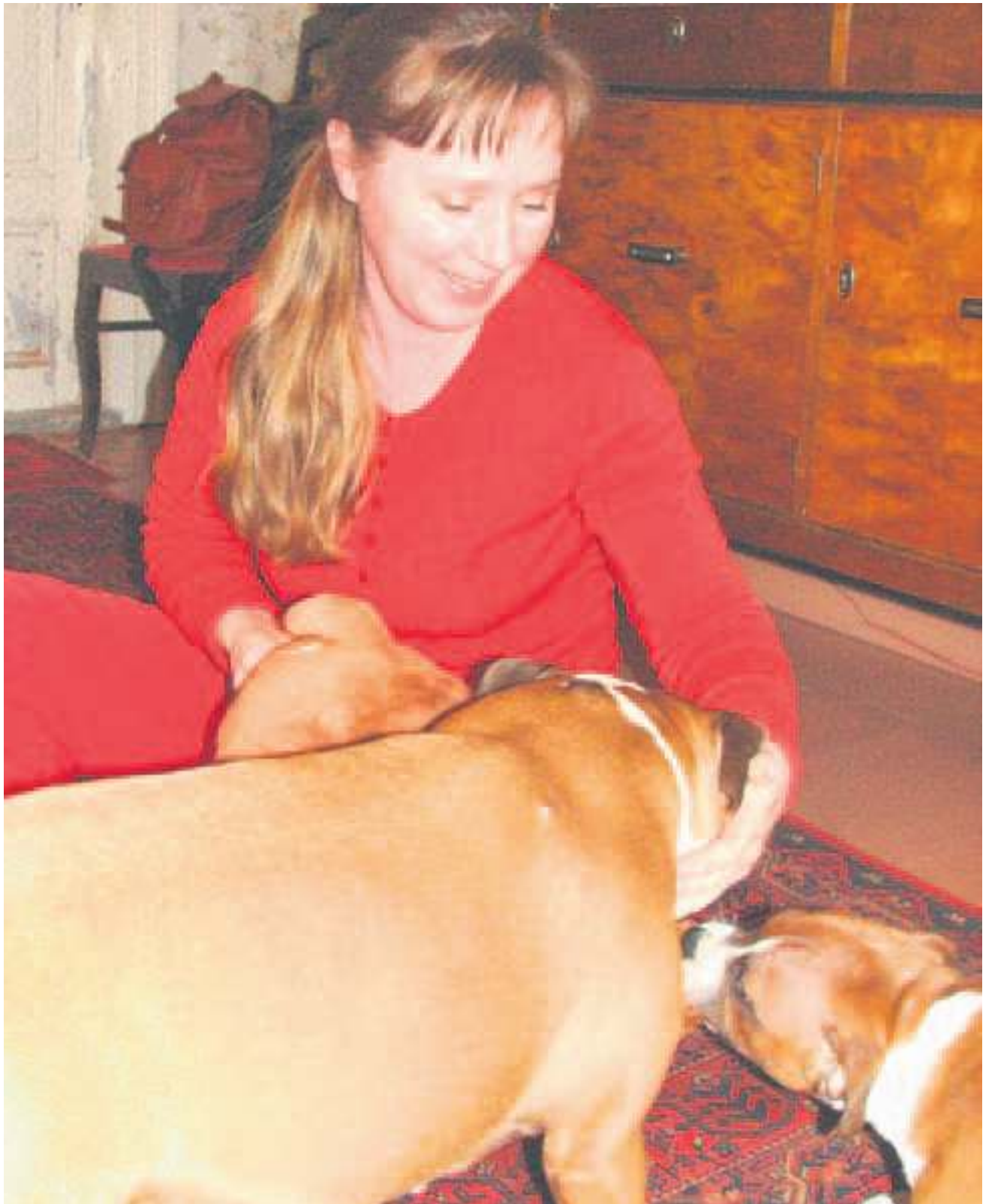
Tyttö ja Poppet leikkivät emäntänsä kanssa.

”Liikkuminen ja koko Röölan rannan elämä vaikeutuu entisestään, kun yhteysalusliikenne Röölasta on päätetty kesälläkin lakkauttaa.”